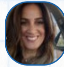
عنات يرتس جوطرمان