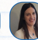
بروفيسور عينات هيد متسويانيم

مدة الدورة هي 60 ساعة على مدار سنتين - في المجلد 120 ساعة.